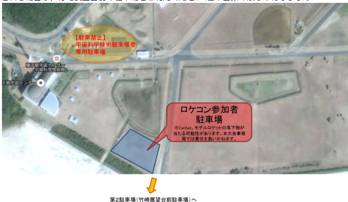
図1. 種子島宇宙センター駐車場